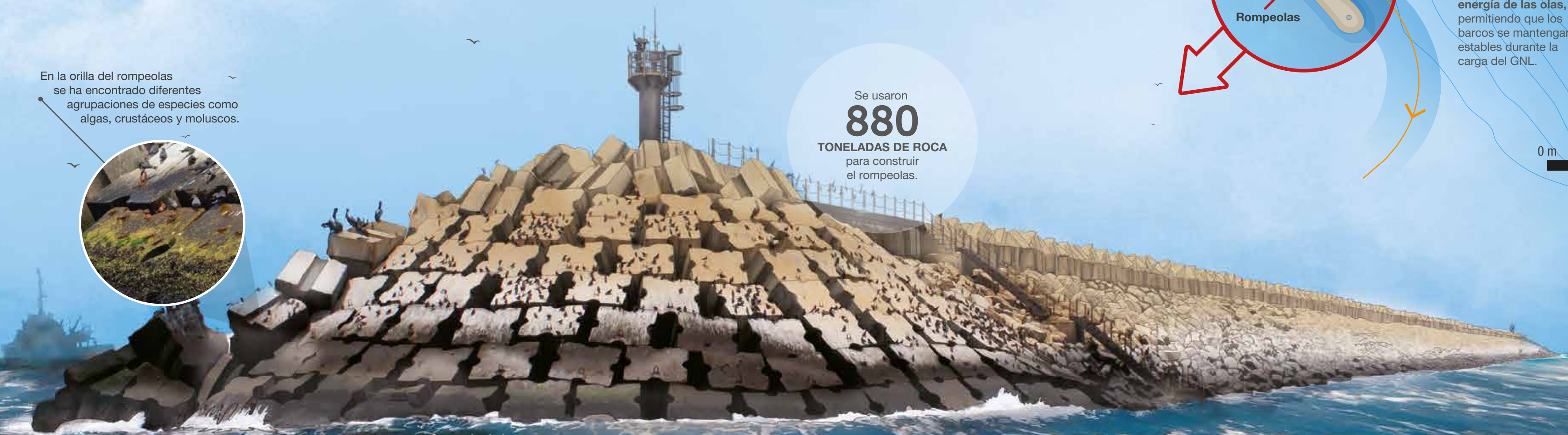
Cangrejo de las rocas Grapsus grapsus